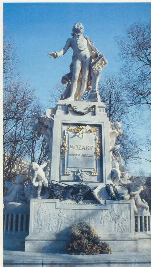
Mozart, immortalisé dans le Burggarten

Offre exceptionnelle du 29 décembre au 2 janvier