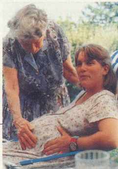
Troisième prix: photo Maurice Perrelet.