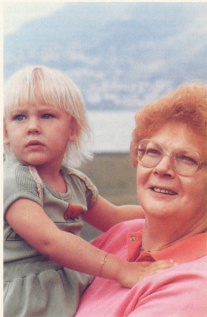
Premier prix:

Le concours de photos sur le thème des générations, proposé dans le numéro 7-8 de «Généralions» a connu un grand succès. Nos félicitations aux gagnants. Et merci à tous!