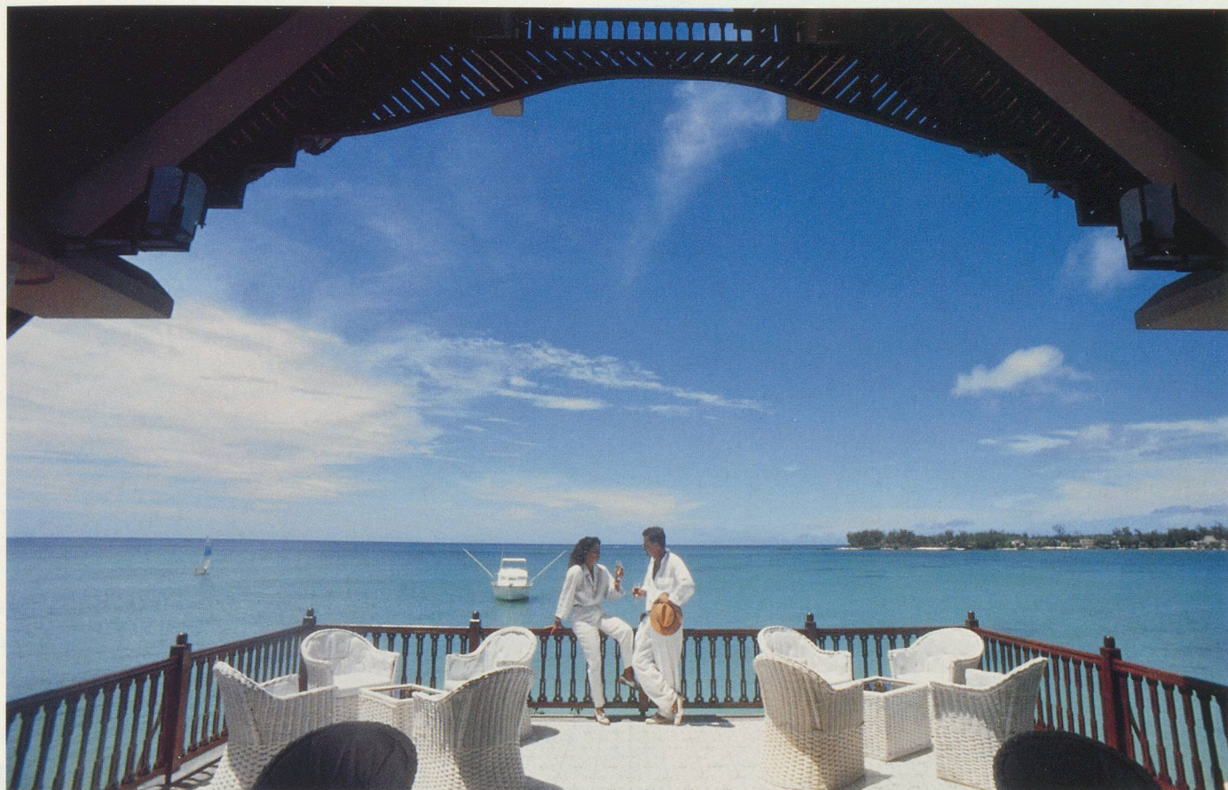
Un petit coin de paradis découvert depuis la terrasse du Royal Palm à Grand Baie