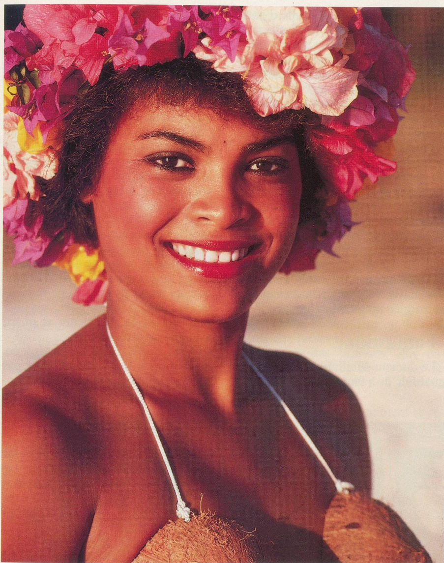
La joie de vivre éclatante d'une Mauricienne