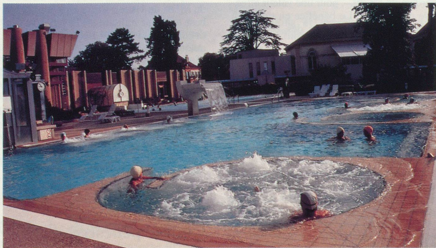
Le bassin thermal d'Yverdon-les-Bains

Nous ne pouvons donc que vous recommander de vous renseigner de façon détaillée auprès de votre caisse-maladie avant d'entreprendre une cure.