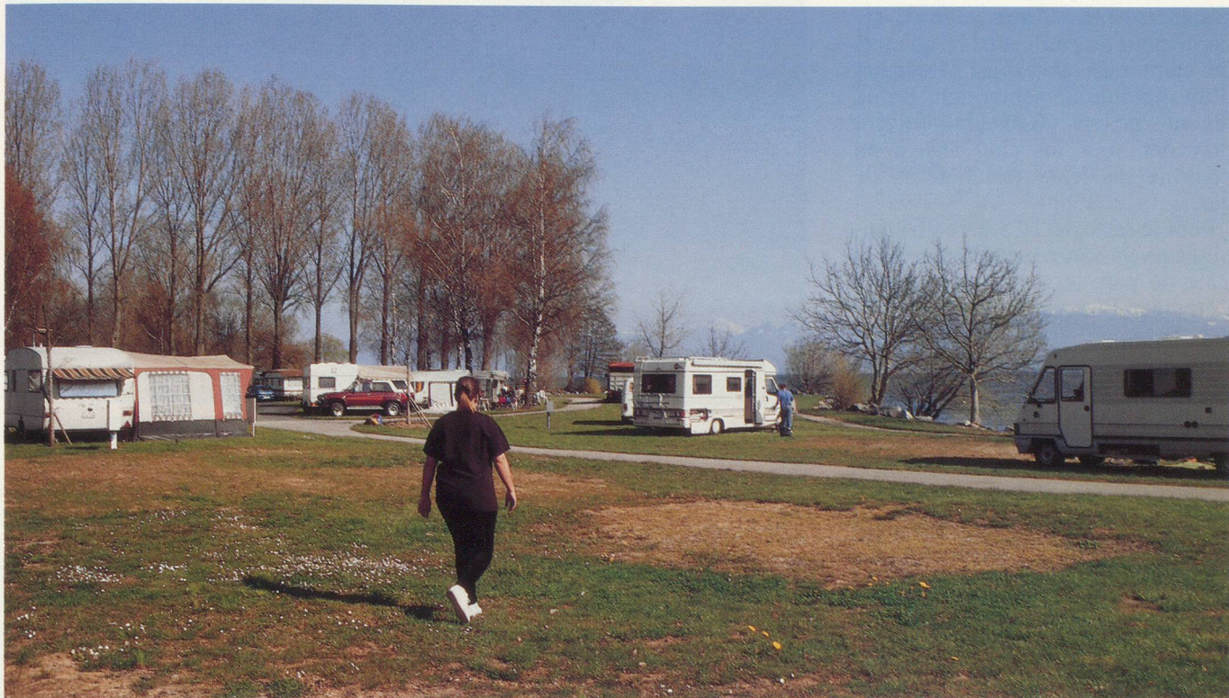
Dans certains campings, on peut parquer sa caravane pour la belle saison

de 20% en Suisse et 10% à l'étranger. Les prix pratiqués dans les campings, relativement avantageux, comprennent également la sécurité, un élément non-négligeable à notre époque.