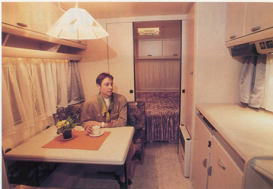
Le confort intérieur des caravanes est très soigné

Axes très difficiles: N1, N12, N6, contournement de Berne; N1, N9, contournement de Lausanne; N9, Vevey-Chexbres; N2, entrée du tunnel du St-Gothard; frontières de Bâle, Chiasso, Genève-Bardonnex et Thônex-Vallard.