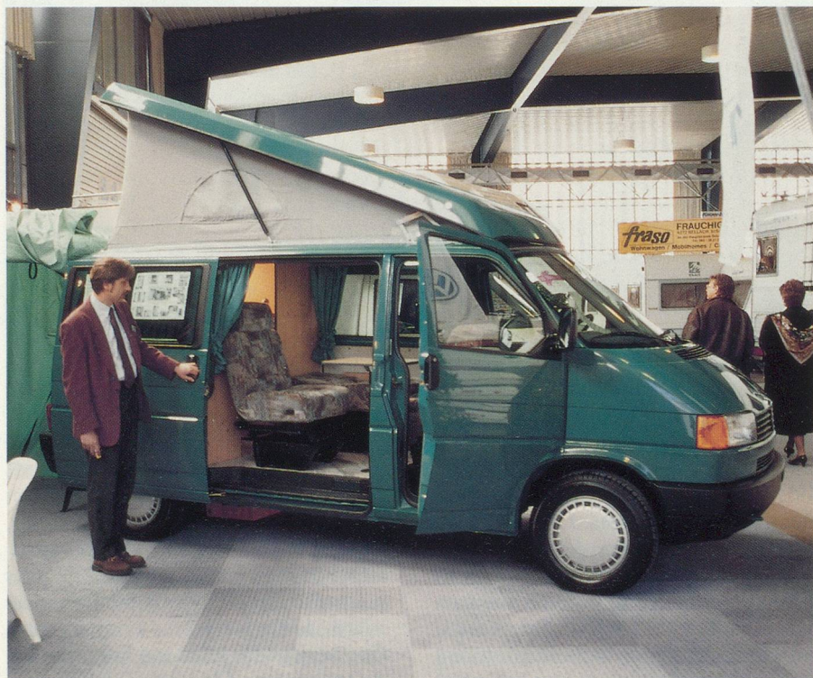
Les bus camping, de véritables salons roulants

Les retraités ne bénéficient pas de tarifs préférentiels. Membres campeurs TCS, ils obtiennent un rabais