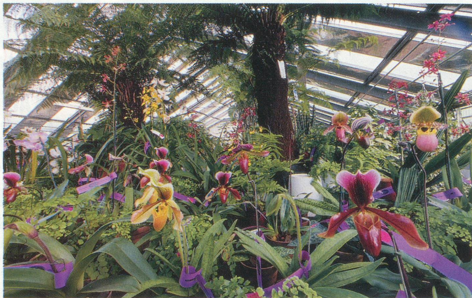
Un paradis exotique à deux pas de chez vous

L a maison Schilliger à Gland n'en finit plus de s'agrandir. Sur 10 hectares, le garden center propose tout ce que l'on peut imaginer en relation avec le jardin, la maison ou les loisirs proches. Des piscines, des jacuzzi, des meubles de jardin, des vérandas, sont en exposition à l'extérieur. Mais il y a aussi toutes les plantes, arbres, fleurs ou buissons de jardin. A l'intérieur, les serres tempérées regorgent de plantes en pots exotiques et luxuriantes. Des bonsaïs, des cactus, des orchidées, rien n'a été oublié. On trouve des assortiments de matériel de jardin, bien sûr, mais aussi une boutique étonnante qui mise sur la décoration d'intérieur. Vaisselle, mobilier, linge de table y ont leur place. Pour Noël et Pâques, des boutiques temporaires déclinent les