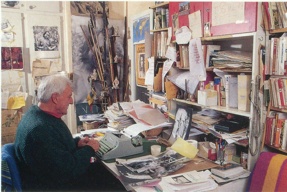
Tout au long de sa vie, Paul Lambert fut également auteur de pièces dramatiques

forêts pour se nourrir d'insectes, de fruits et de chasse.