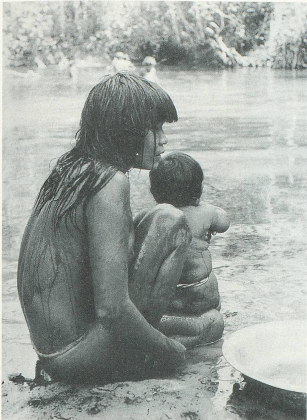
Au bord du Rio Xingu, cette jeune maman a des gestes très doux pour son enfant

Dans son petit appartement jonché de souvenirs amazoniens, de sculptures en terres cuites, de coupures de journaux et de cartons de bouquins, il a trouvé une sérénité et une sagesse qui lui permettent d'espérer encore en l'avenir.