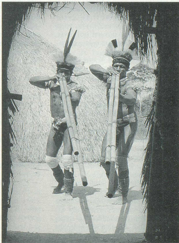
Les indiens Meinaco jouent de la double flûte pour chasser les mauvais esprits

– On est resté quatre ou cinq jours. Et puis ensuite, je suis reparti à Brasília, afin d'organiser une expédition en solitaire dans une grande réserve d'indiens du Xingu. Les gens qui s'en occupaient voulaient les sauver en les préservant des contacts avec les Blancs. A la saison des pluies, ces indiens étaient sédentaires, puis ils partaient à travers les