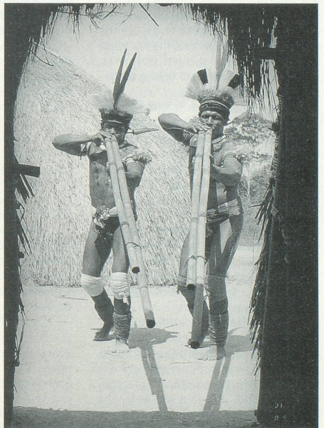
Les indiens Meinaco jouent de la double flûte pour chasser les mauvais esprits

– On est resté quatre ou cinq jours. Et puis ensuite, je suis reparti à Brasília, afin d'organiser une expédition en solitaire dans une grande réserve d'indiens du Xingu. Les gens qui s'en occupaient voulaient les sauver en les préservant des contacts avec les Blancs. A la saison des pluies, ces indiens étaient sédentaires, puis ils partaient à travers les