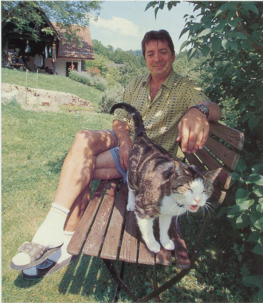
Séance de relaxation sur le banc ombragé, en compagnie de Félix, le matou de douze ans

– Parmi mes amies, il y a pas mal de personnages qui fonctionnent avec l'astrologie, qui ont étudié mon thème astral. Si bien que je crois assez à l'astrologie. Moins à la voyance à travers la boule de cristal. C'est vrai qu'à 17 ans, je suis allé consulter une voyante, parce que je voulais aller en Australie. A l'époque, j'étais apprenti dessinateur et j'avais fait les démarches auprès du consulat, je voulais émigrer. On nous payait le voyage, simple course et on nous logeait pendant trois mois. Cette voyante travaillait d'après la graphologie. Sur la base de ma question écrite, elle m'a dit: vous ne partirez pas! Elle a ajouté qu'elle ne me voyait pas exercer ce métier de dessinateur, mais que je parlerais à des gens, que je donnerais des signatures. Cela s'est concrétisé.