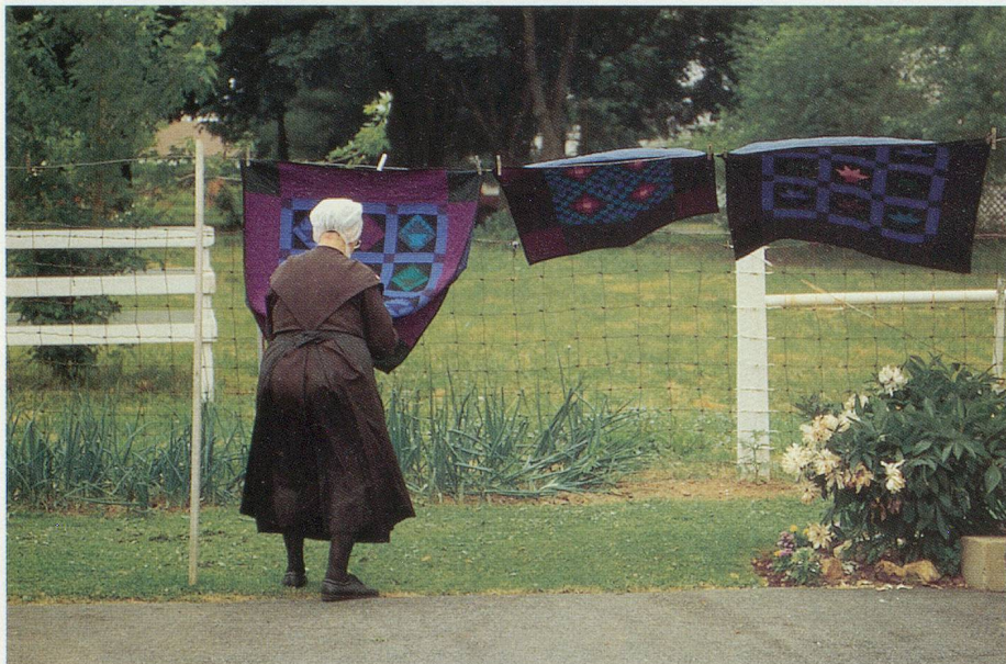
A l'heure de la retraite, les femmes amish confectionnent des quilts

Bien qu'ils vivent selon des règles établies au 17 e siècle, les Amish ont su créer une société qui intègre harmonieusement les personnes âgées. Un exemple à méditer. Reportage de notre collaborateur qui a vécu dans une communauté Amish des Etats-Unis.