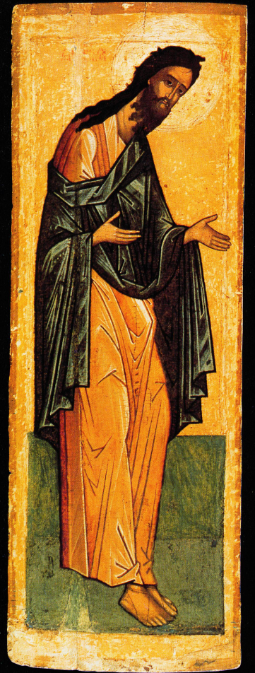
Saint Jean le Précurseur