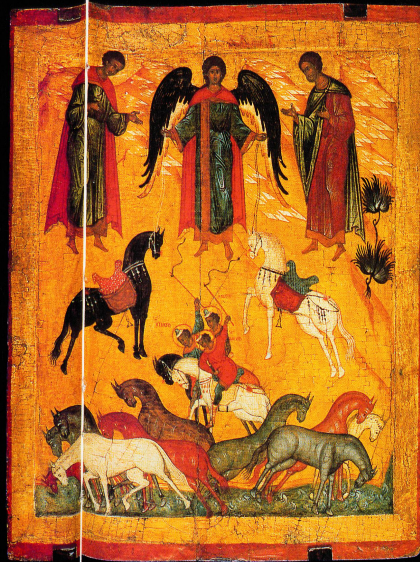
Miracle de l'Archange Michel sur Florus et Laurus, début XVI e siècle