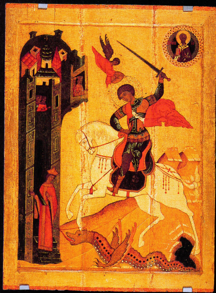
^ Le miracle de Georges ferrassant le dragon (fin XV e siècle)