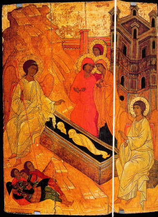
< Les myrraphores, XVI e siècle