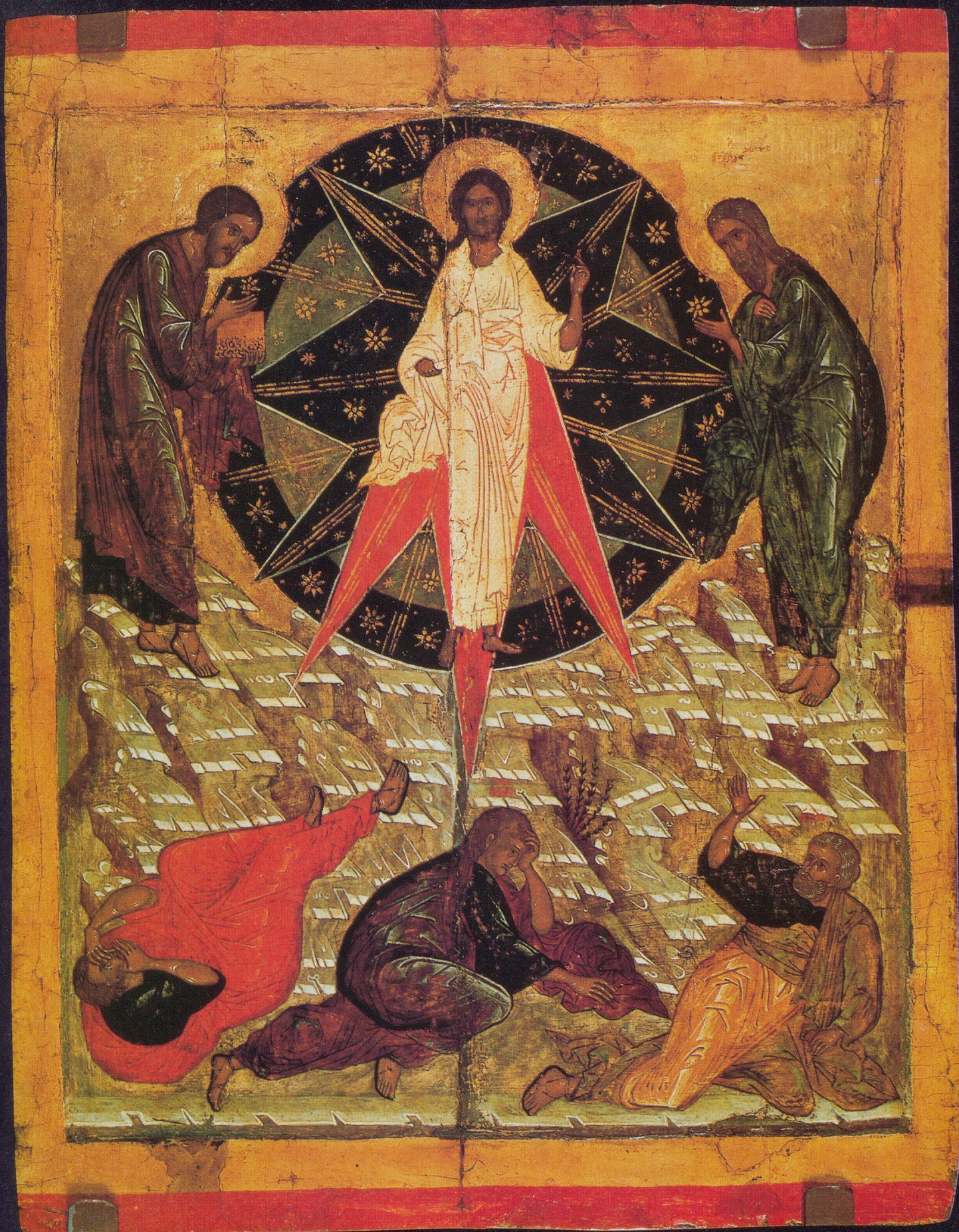
La Transfiguration (apparition de Jésus-Christ à Pierre, Jacques et Jean), milieu du XVI e siècle