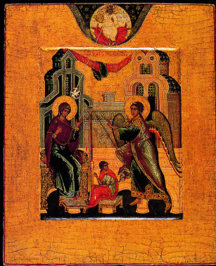
L'Annonciation, XVI e siècle >