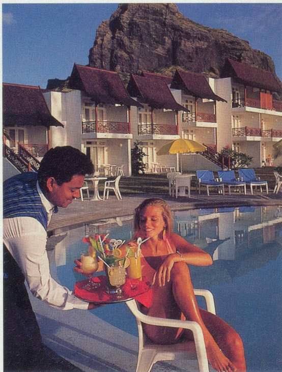
L'accueil chaleureux des Mauriciens