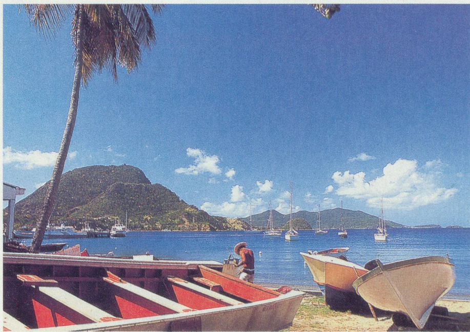
Les trois-quarts des Saintois sont des pêcheurs

Depuis les Saintes, un bateau fait la navette avec les îles de la Guadeloupe, de Marie-Galante, de La Dominique, de La Martinique et de Sainte-Lucie.