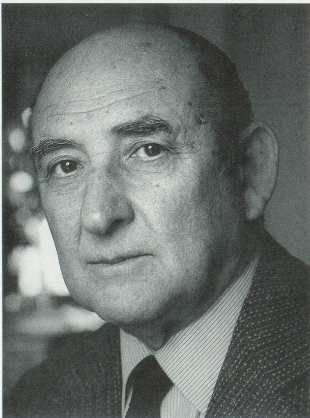
Un artiste passionné de musique et d'architecture

Coppet a gardé tout son charme. On y apprécie la sérénité de ses vénérables maisons d'un autre siècle. Une enseigne rongée par la rouille, battue par les vents et la pluie, elle est peu lisible. On distingue malgré tout l'inscription: «Le Vieux Couvent». La maison date de 1490. C'était effectivement un couvent. Depuis la fin du 15 e siècle, la vieille bâtisse a connu bien des locataires. Au printemps de 1967, j'y ai rencontré le pianiste Nikita Magaloff.