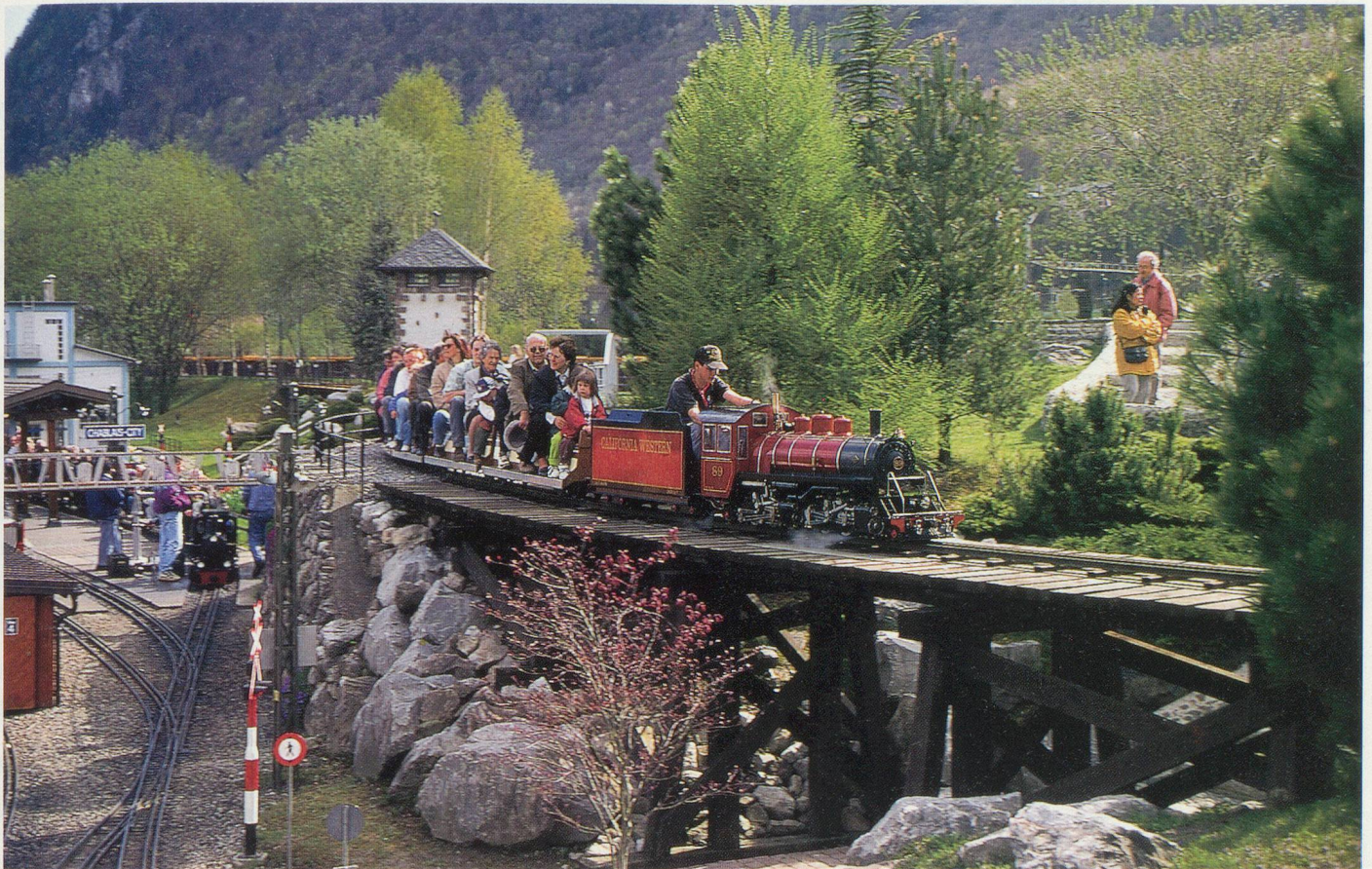
Au Swiss Vapeur Parc du Bouveret, les trains miniatures sont pris d'assaut tant par les petits que par les grands

Pringy, puisqu'on fabrique encore ici le fromage au feu de bois et à la force du poignet. Tous les ustensiles d'antan témoignent de la tradition des armaillis. Là aussi une présentation audiovisuelle vous apprendra tous les secrets de la pâte dure, mais eux aussi ceux de la salaison fumée et autres produits de la borne. Et, sur place, on peut déguster toutes ces alléchantes spécialités, de la crème double aux meringues en passant par le jambon fumé. De bonnes calories après l'effort de la promenade. Si les petits se sont lassés des dégustations de fromage, ils ne seront pas déçus par l'impressionnant toboggan-bob de Moléson. Les luges, tractées par un remonte-pente, dévalent la pente dans une sorte de piste de bob en plastique. Les grands-parents audacieux peuvent s'y risquer. Pour les plus prudents, un mini-golf agrémenté d'une buvette amusera sans péril toute la famille.