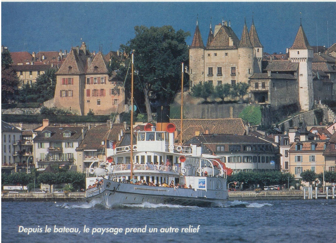
Depuis le bateau, le paysage prend un autre relief

Aujourd'hui, les vacanciers sont devenus exigeants. S'ils apprécient une petite croisière en bateau, ils veulent aussi un but de promenade, une combinaison d'activités pour une journée. C'est pourquoi les compagnies de navigation se mettent à proposer des billets combinés rails-bateau pour répondre à cette demande. «Sur le Léman, nous avons par exemple imaginé une excursion qui s'appelle Rhône-Express, rappelle M. Hefti. Depuis Genève, le bateau «le Rhône» remonte en direction