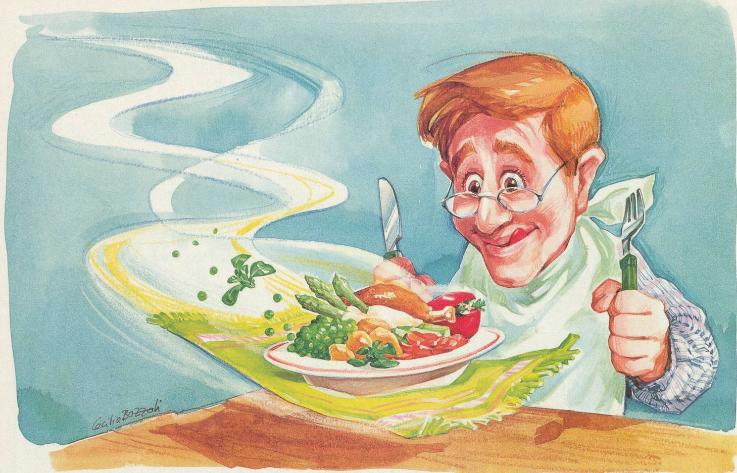
Dessin Cecilia Bozzoli