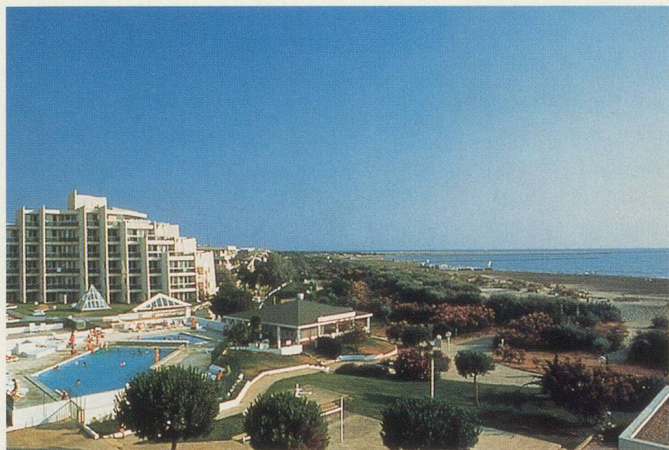
Le centre Thalassa Port-Camargue

Offre spéciale du 27 septembre au 4 octobre