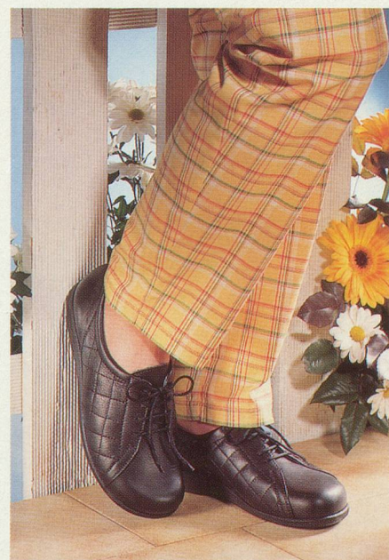
Les modèles d'automne d'Helvesko

la gamme de «trotteurs», chaussures en cuir à lacets, légèrement surélevées, est particulièrement pratique en ville ou en voyage. Les élégantes un peu plus classiques peuvent également trouver les modèles «Confort Lady», plus larges et