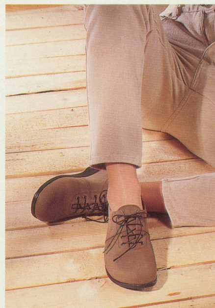
Des trotteurs élégants et confortables