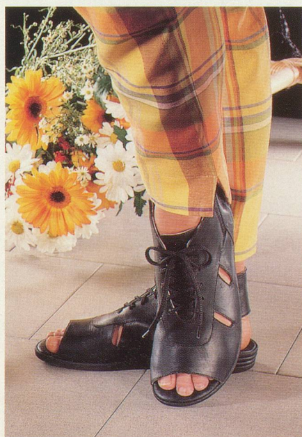
Pour l'été, un grand choix de sandales