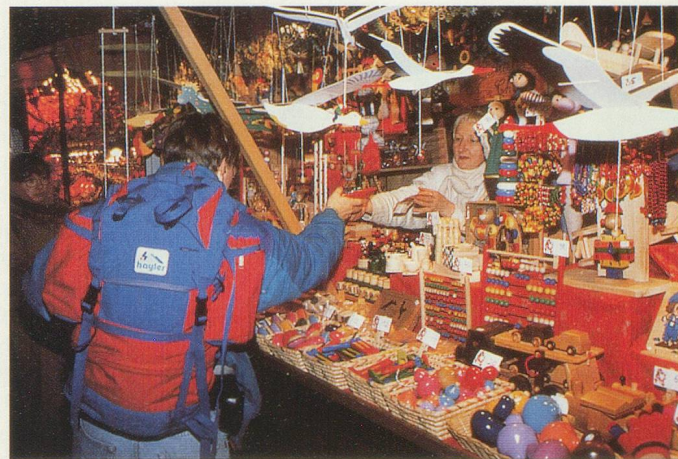
Le marché de Noël de Strasbourg

Samedi 12 décembre. – Après le petit déjeuner, débarquement et