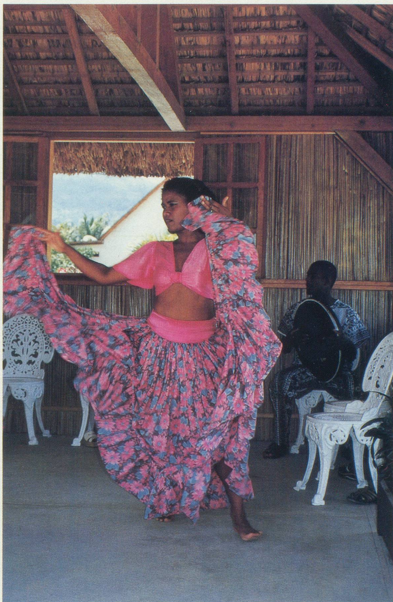
Au Domaine des Pailles, une démonstration de sèga, la danse traditionnelle

A dix minutes en voiture de la capitale, Port Louis, le Domaine des Pailles fait oublier l'agitation de la ville. Créé en 1991, ce parc de 1500 hectares a pour vocation de faire revivre l'époque coloniale. Le visiteur quitte son véhicule au parking pour monter dans une belle calèche. Le voyage dans le temps commence. Arrêt au moulin à sucre: comme au 18 e siècle, les cannes y sont pressées une à une, tandis qu'un buffle a remplacé l'esclave qui tournait la roue. Le jus de canne, récolté dans des cuves, est ensuite chauffé au feu de