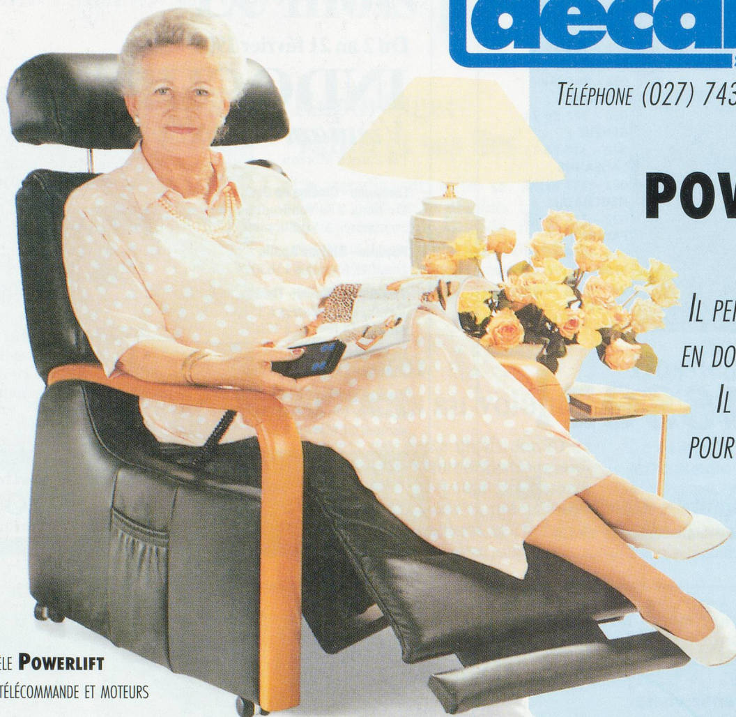
MODÈLE POWERLIFT AVEC TÉLÉCOMMANDE ET MOTEURS