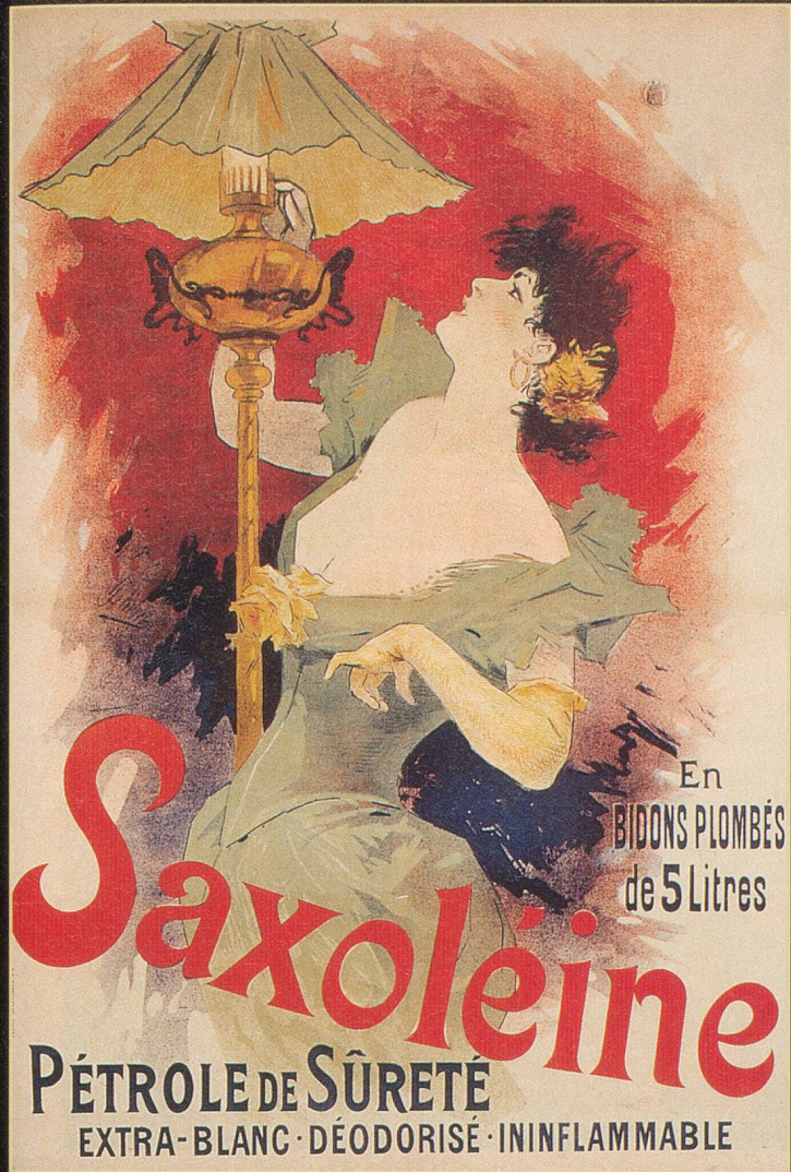
Jules Chéret excelle aussi dans l'art de l'affiche