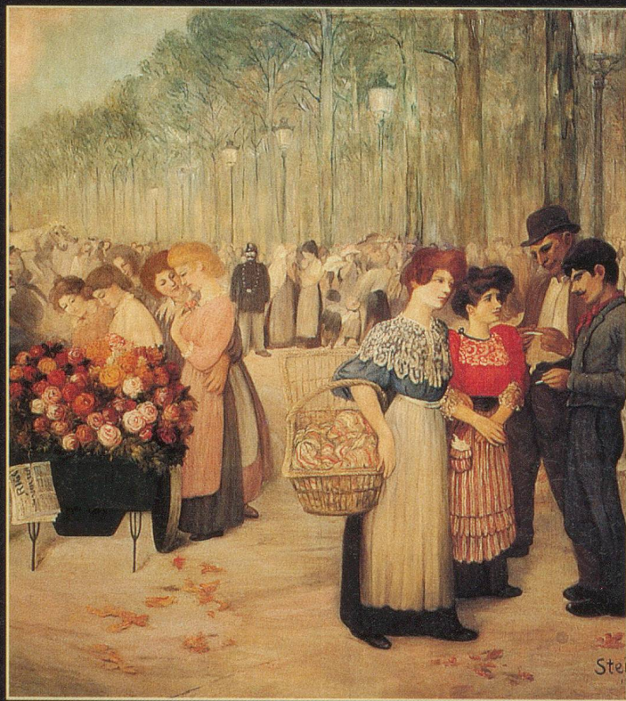
Triptyque sur Montmartre, où vivait l'artiste