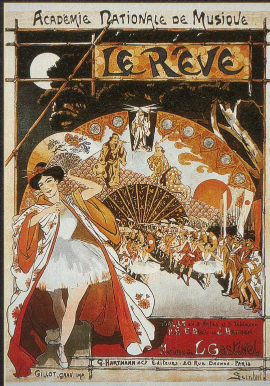
L'affiche publicitaire devient œuvre d'art avec Steinlen

Dans cet univers bouillonnant, il se passionne pour les discussions politiques et fréquente socialistes et anarchistes au cabaret du «Chat Noir». Les caricatures qu'il produit