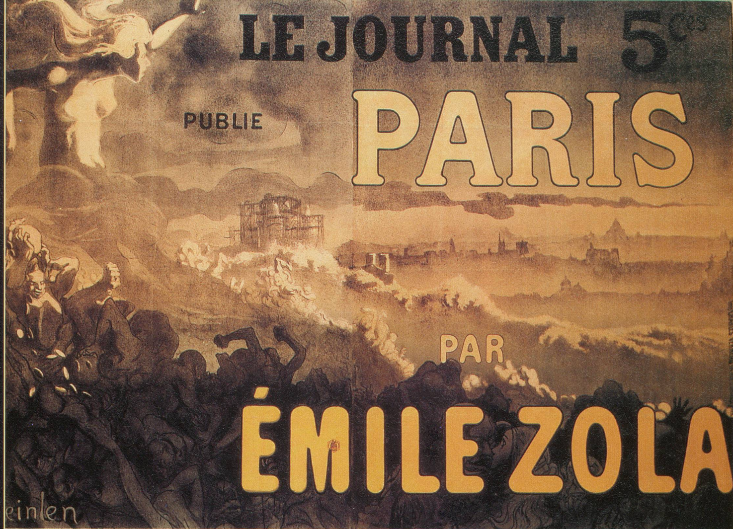
Steinlen illustre les œuvres de son ami Zola