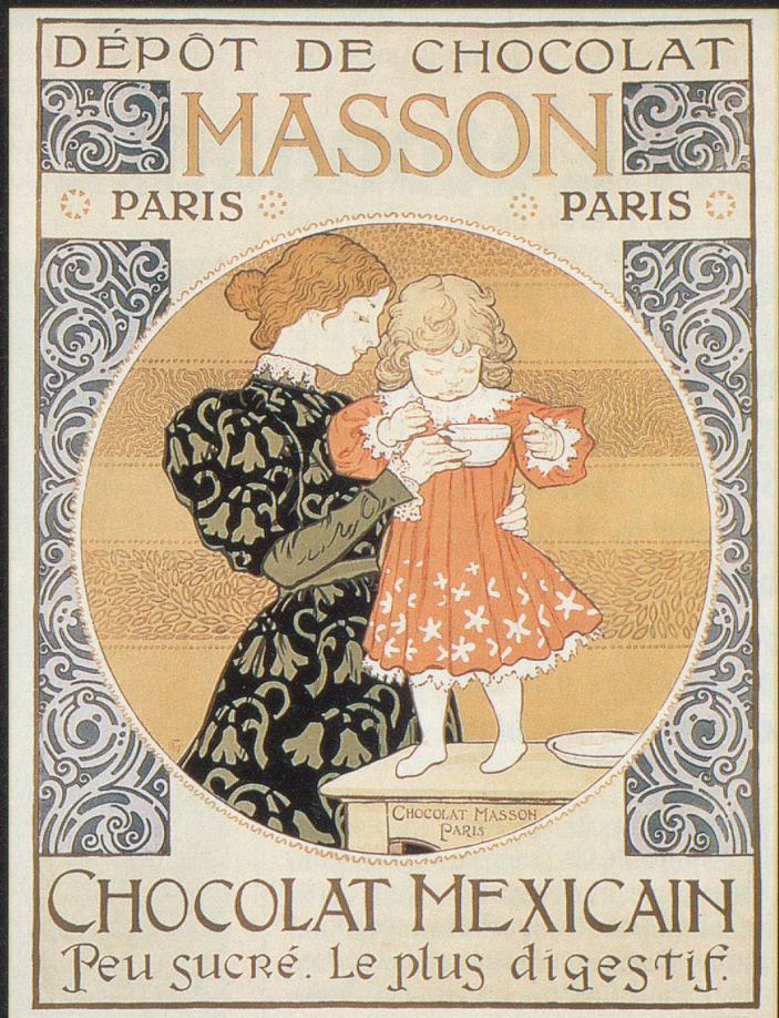
L'exposition fait la part belle aux autres artistes de la Belle Epoque, comme ici Eugène Grasset