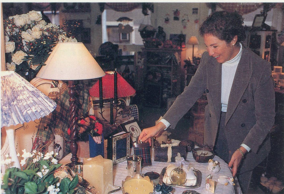
A la Boutique Brocéliande , à Lausanne, des objets pour toutes les bourses

Rasoir Cool Skin , de Philips, en vente en magasins spécialisés.