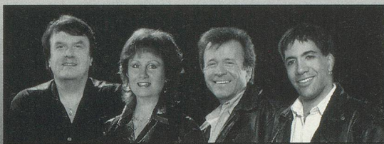
SWEET PEOPLE "Sierra Madre" "Quand on revient d'ailleurs"