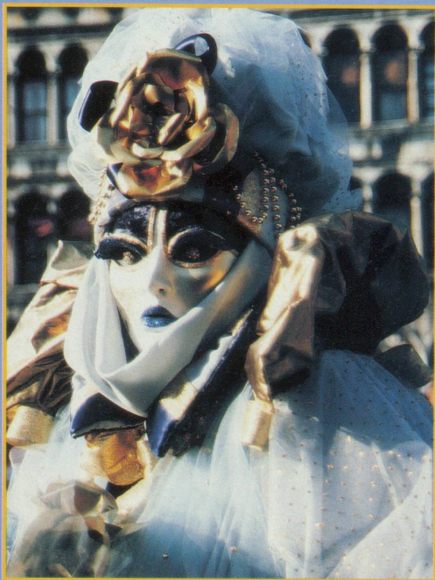
La Reine des Neiges sur la place Saint-Marc