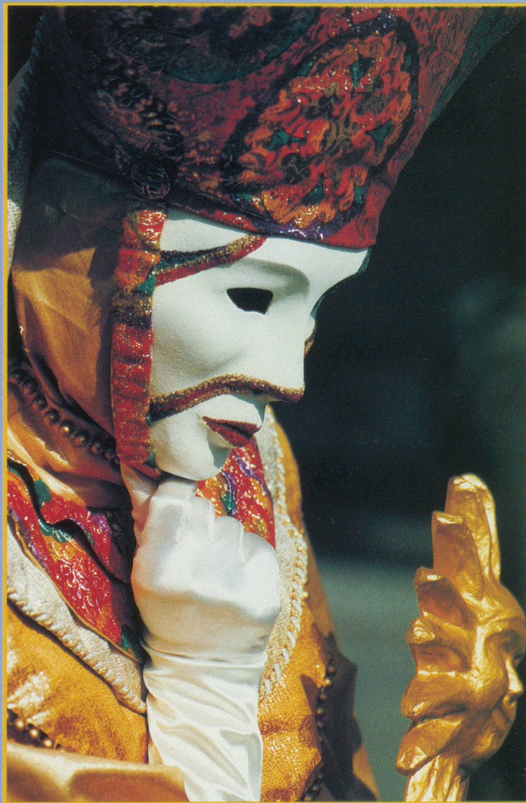
Le roi-soleil règne sur Venise

l'époque du carnaval, qui se déroule pendant les dix jours qui précèdent le mardi des Cendres. Le succès de cette manifestation est tel qu'il est quasi impossible de trouver une chambre d'hôtel loin à la ronde. L'accès même à Venise devient difficile et la Riva degli Schiavoni, qui longe la lagune, du Palais ducal à l'Arsenal, est