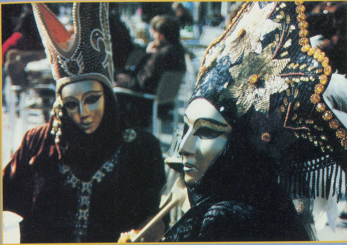
Certaines coiffes sont de véritables chefs-d'œuvre