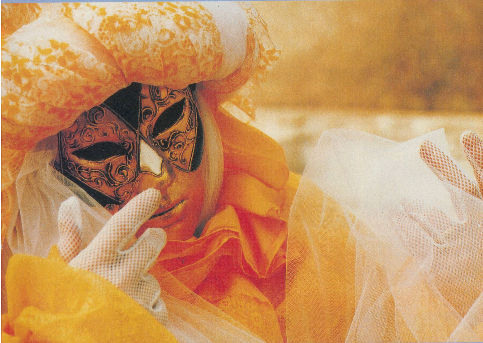
Les costumes sont taillés dans des tissus précieux