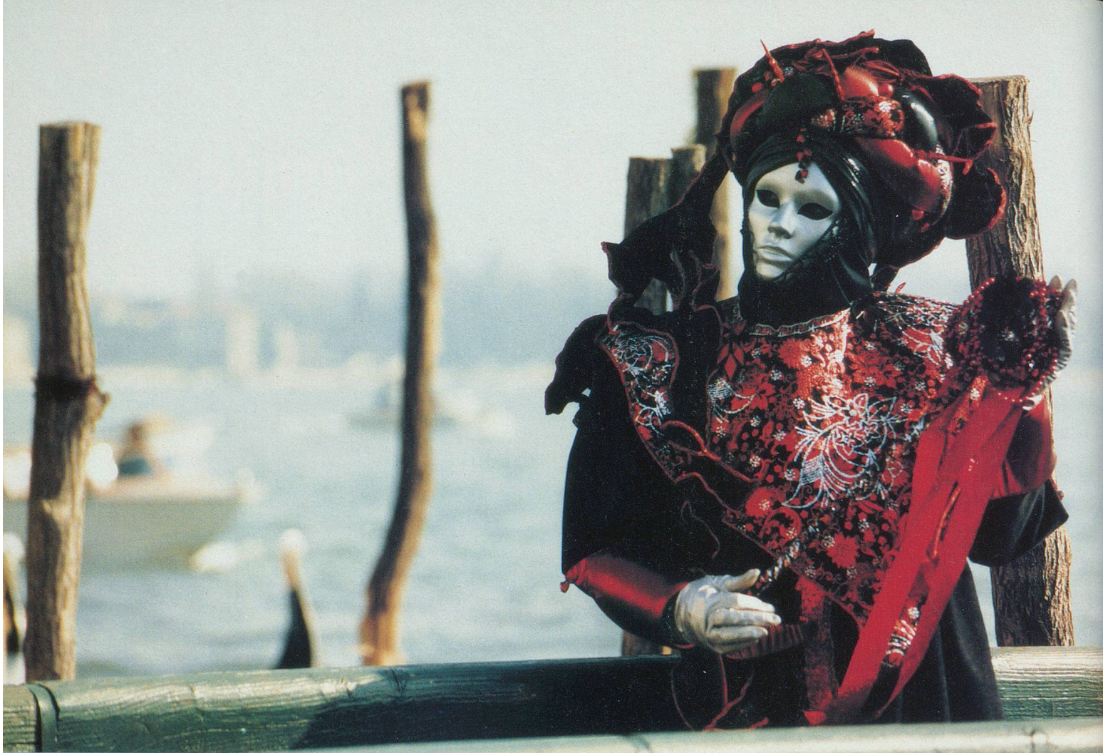
Un sultan fantomatique devant le Grand Canal