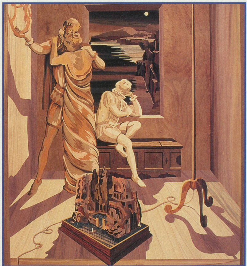
Le trompe-l'œil est abondamment utilisé en marqueterie

Les artisans marqueteurs sont toujours à la recherche de bois veinés particuliers et de tons inédits. Par exemple, la fuite de dioxine, qui avait