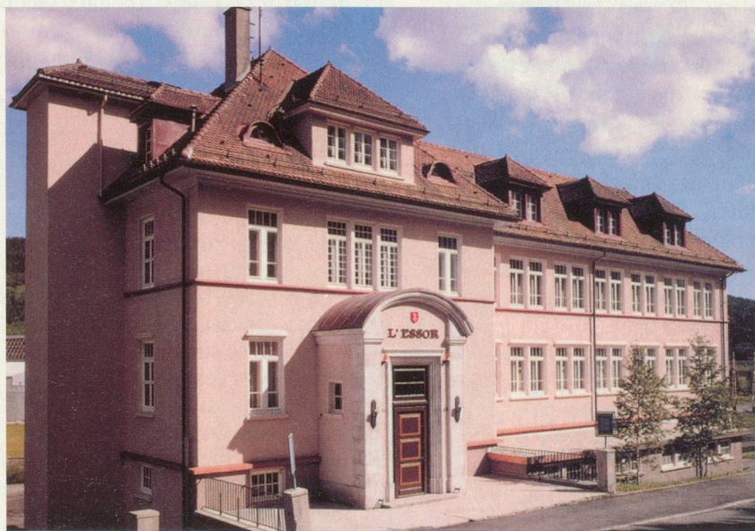
Le Centre culturel de l'Essor, au Sentier, abrite l'Espace horloger

Exposition La lime et l'horloger , Espace horloger de la Vallée de Joux, Le Sentier, jusqu'à fin octobre. (Accès aisé aux personnes à mobilité restreinte).