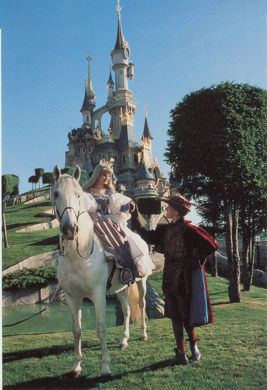
Un prince charmant et sa belle, pour faire rêver les enfants...

lent quelques instants sur la place de jeu de Pocahontas. Cette récréation est bienvenue. Toutes ces attractions requièrent, chez les marmots, une attention qu'ils ont parfois peine à soutenir des heures durant. Et c'est un peu pareil pour les adultes... Dans tout le parc, des restaurants et des cafés aux vastes terrasses permettent aussi un arrêt plus substantiel.