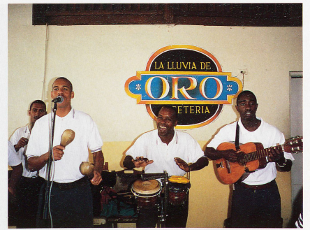
Tous les prétextes sont bons pour faire de la musique et pour danser

Les seuls Cubains qui hantent le hall de l'Hôtel Ambos Mundo sont les serveurs et les deux musiciens qui distillent des rengaines pour touristes en mal de nostalgie. On ne peut s'empêcher de s'ins-