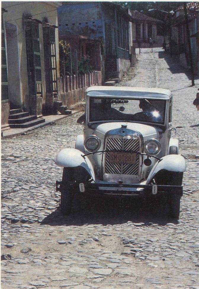
Une Ford de 1928 crachote dans les rues pavées de Trinidad