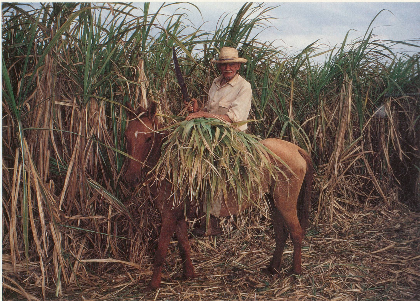
Les coupeurs de canne à sucre utilisent souvent des méthodes venues du fond des âges

cie dans la vie quotidienne du peuple cubain. Chef-d'œuvre de l'architecture coloniale, la cathédrale est entourée de somptueux palais, dont la Maison du marquis des Eaux Claires, transformée en restaurant. Une ruelle mène à la Taverne du