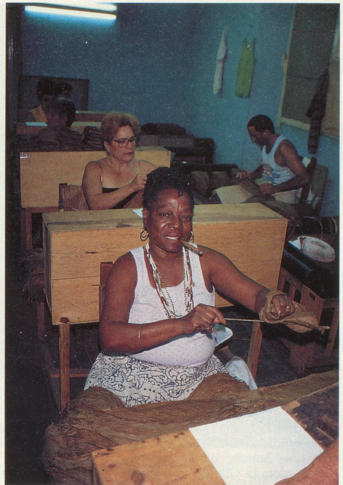
Dans la petite manufacture de tabac, une ouvrière sépare la nervure de la feuille

mat, le tabac, en revanche, trouve dans cette région tous les éléments favorables à sa culture. Il y fait chaud, mais l'air est constamment ventilé, ce qui est favorable au séchage des feuilles.