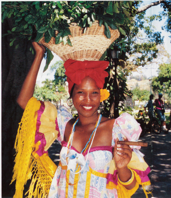
Une belle cubaine dans le costume de fête des esclaves du siècle passé

Juste en face de la statue de José Martí, le libérateur de la nation, un marchand de café propose des ristretti dans des tasses de papier à peine plus grosses qu'un dé à coudre. Comme le vieux fleuriste ou le marchand de cacahuètes, il appartient à cette cohorte de petits métiers qui grappillent quelques pesos pour tenter de survivre. Depuis que l'île s'est ouverte au tourisme, il y a une demi-douzaine d'années, les vendeurs de babioles pullulent autour du Parc Central et de l'Académie des sciences,