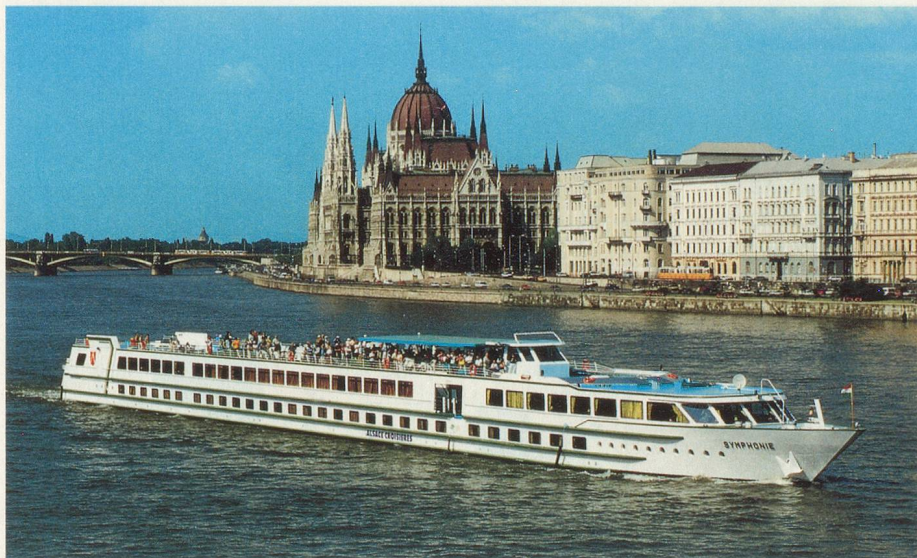
Un voyage inoubliable sur le beau Danube

Visitez Vienne et Budapest de façon originale! A bord du MS Bohème , un hôtel flottant très confortable, vous sillonnerez le Danube à la découverte des trésors de l'ancien empire austro-hongrois.