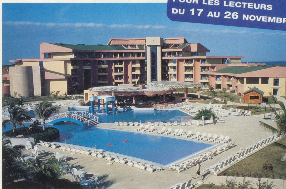
Le superbe Hôtel Coralía Club Playa de Oro, à Varadero

Mercredi 22 novembre. Visite de la ville de Cienfuegos et du Théâtre Terry, du Malecon et du Paseo del Prado. Déjeuner au Restaurant du