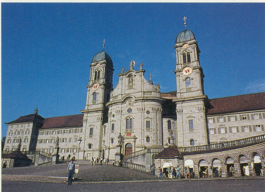
L'Abbaye d'Einsiedeln et son parvis, où ont lieu les spectacles

N'hésitez pas à demander conseil à l'Office du tourisme qui vous donnera tous les renseignements sur les concerts, les manifestations du moment et vous indiquera les balades et les promenades à entreprendre dans les alentours d'Einsiedeln. Si le cœur vous en dit, vous pouvez suivre, sur quelques kilomètres, le chemin que prenaient les pèlerins venant du sud de l'Allemagne pour se rendre à Saint-Jacques de Compostelle.