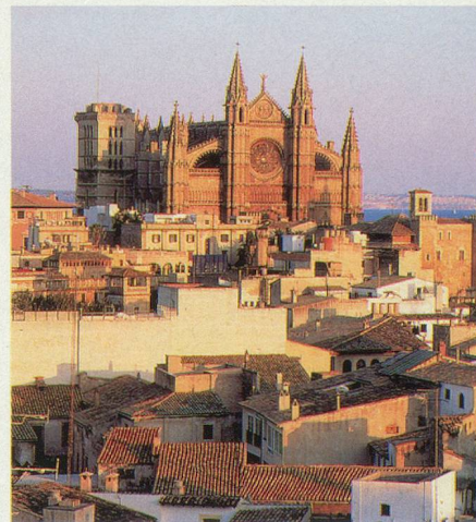
Vue générale de Palma

Inclus dans le prix: vol aller et retour, logement en chambre double dans un hôtel***, demi-pension, transferts entre l'aéroport et l'hôtel, un accompagnant au départ de la Suisse. (Non compris: assurance annulation, dépenses à caractère personnel, excursions facultatives).