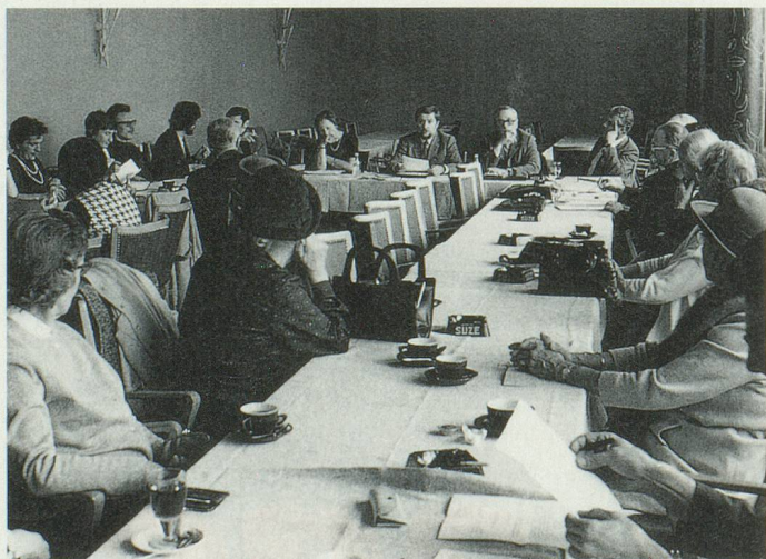
En 1972, l'une des premières assemblées des membres de la Société coopérative Aînés