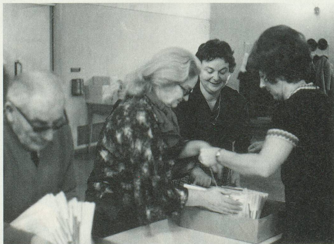
La mise sous pli du magazine, par une équipe de bénévoles, dans la paroisse de Saint-Marc, à Lausanne