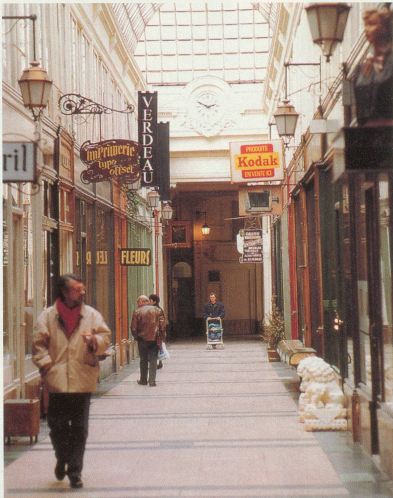
Passage Verdeau, tout le charme du Paris méconnu

Lorsqu'il fait trop froid sur la capitale pour se promener dans ses magnifiques parcs, saisissez l'occasion de quelques heures de loisirs pour partir à la découverte des passages couverts parisiens. Nostalgie et émerveillement assurés.