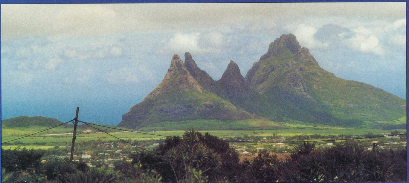
Les paysages de cette île sont d'une grande richesse: curieuses montagnes, gorges sauvages, immenses champs de canne à sucre, plantations de thé verdoyantes (ici la côte ouest). Willy Cuany, Lausanne