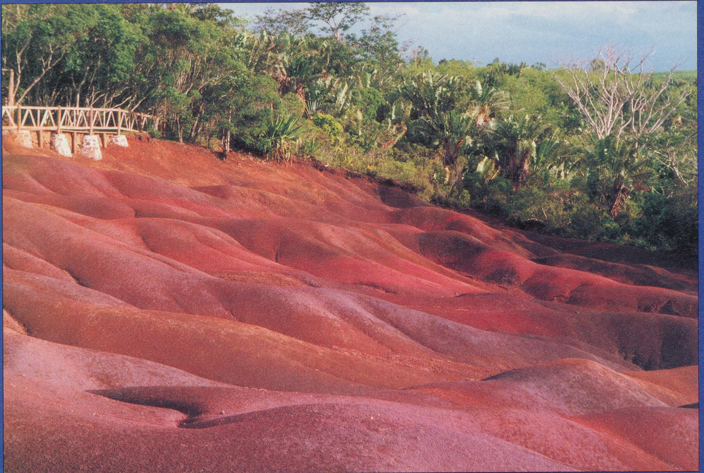
A part les plaisirs de la baignade, tous les deux jours nous étions en excursion organisée afin de visiter les plus beaux endroits (ici les Terres de Chamarel) Willy Cuany, Lausanne