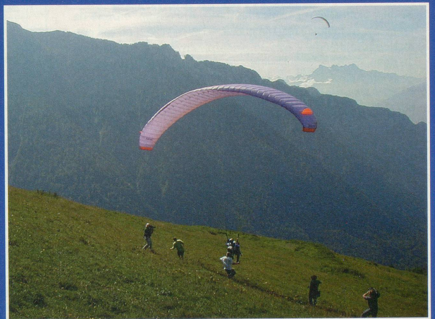
Un décollage en douceur