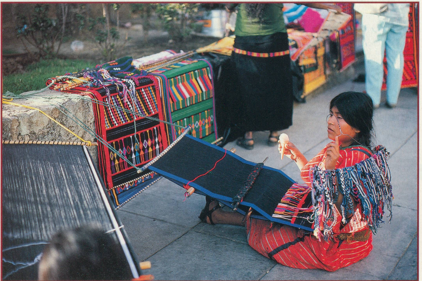
Les marchés mexicains, très colorés, sont des lieux de rencontre importants

Les villes de Puebla, Oaxaca, Palenque et Mérida se situent au centre de provinces parsemées de grandioses vestiges précolombiens.