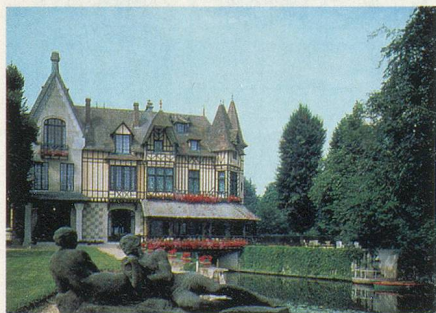
Un charmant hôtel en Normandie

Vendredi 5 mai. Matinée libre au Mont-Saint-Michel, spectacle de la marée. L'après-midi, excursion vers Saint-Malo, l'ancienne ville des corsaires. Visite de la ville et promenade sur les remparts.