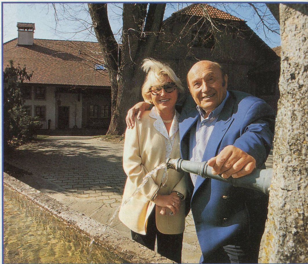
Frédéric Dard avait la rage d'écrire

«Plus je vieillis et moins je me prends au sérieux, m'avait-il avoué. Je ne me suis d'ailleurs jamais beaucoup intéressé à ce que l'on pensait de mes livres. Depuis qu'on glose sur mes bouquins, j'ai toujours l'impression qu'il s'agit d'un autre que moi. Je suis écrivain jusque dans la moelle, et pourtant je ne me sens pas écrivain. Je ne suis qu'un artisan de la plume, un pisseur de copie. Et je vais te faire une confidence, je n'ai rien à dire... Alors, pourquoi est-ce que j'écris? Parce que j'écris! Tu n'aurais pas idée de demander à un escargot pourquoi il fait de la bave. C'est dans sa nature de laisser un sillage argenté derrière lui, voilà tout. Je ne me regarde jamais écrire, j'écris. Et si j'écris tellement – 300 romans, 172 San-Antonio – c'est parce que j'en ai besoin. Pas financièrement, mais physiquement, mentalement. Ecrire est tellement lié à