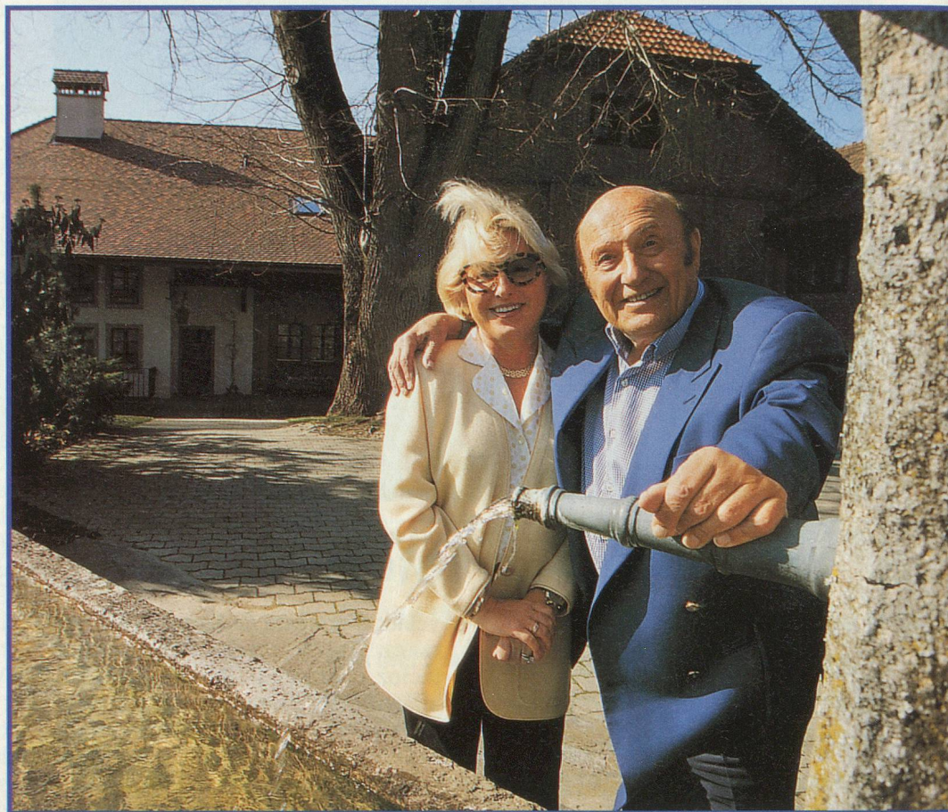
Frédéric Dard avait la rage d'écrire

«Plus je vieillis et moins je me prends au sérieux, m'avait-il avoué. Je ne me suis d'ailleurs jamais beaucoup intéressé à ce que l'on pensait de mes livres. Depuis qu'on glose sur mes bouquins, j'ai toujours l'impression qu'il s'agit d'un autre que moi. Je suis écrivain jusque dans la moelle, et pourtant je ne me sens pas écrivain. Je ne suis qu'un artisan de la plume, un pisseur de copie. Et je vais te faire une confidence, je n'ai rien à dire... Alors, pourquoi est-ce que j'écris? Parce que j'écris! Tu n'aurais pas idée de demander à un escargot pourquoi il fait de la bave. C'est dans sa nature de laisser un sillage argenté derrière lui, voilà tout. Je ne me regarde jamais écrire, j'écris. Et si j'écris tellement – 300 romans, 172 San-Antonio – c'est parce que j'en ai besoin. Pas financièrement, mais physiquement, mentalement. Ecrire est tellement lié à