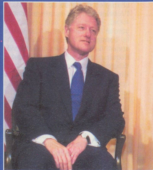
Avec Bill Clinton au Forum de Davos