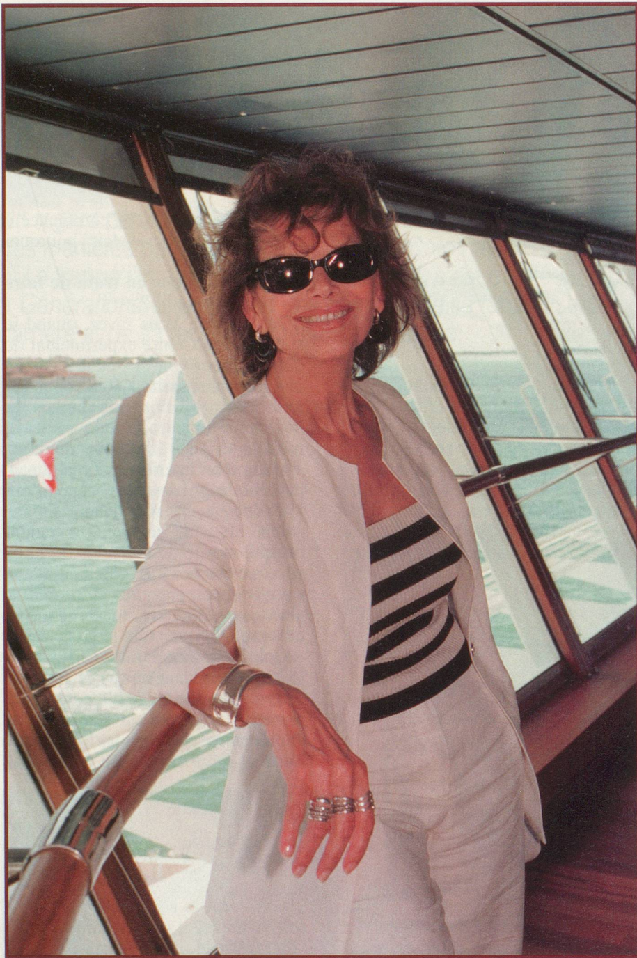
Claudia Cardinale en capitaine de yacht, un rôle complètement improvisé

parce que j'ai toujours pensé que ce n'était pas une bonne chose de se construire un masque.