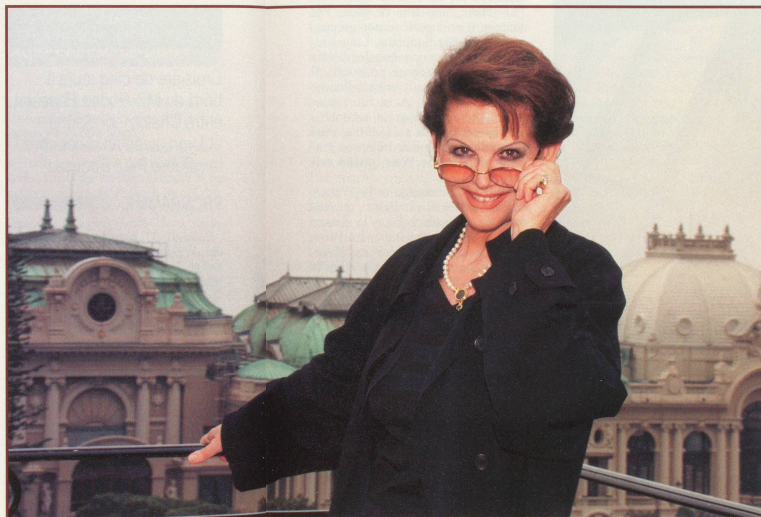
Depuis la terrasse de son appartement, Claudia Cardinale jouit d'une vue superbe sur les toits de Paris

– Quand j'ai reçu la Légion d'honneur, il y a deux ans, le président Jacques Chirac m'a dit: «Vous êtes en quelque sorte la représentation de l'Europe.» En effet, je suis multiculturelle. Je suis née à Tunis, mais mes origines sont siciliennes. Mes arrière-grand-parents étaient natifs d'une petite ville proche de