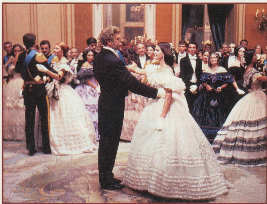
Dans le film de Visconti Le Guépard , elle danse avec Burt Lancaster

Son premier film: Chaînes d'or (1956); Rocco et ses frères , Luchino Visconti (1960); Napoléon à Austerlitz , Abel Gance (1960); Les Lions sont lâchés , Henri Verneuil (1961); Cartouche , Philippe de Broca (1962); La Viaccia , Mauro Bolognini (1962); Huit et demi , Federico Fellini (1963); Le Guépard , Luchino Visconti (1963); La Panthère rose , Blake Edwards (1963); Circus World , Henry Hathaway (1964); Le Cocu magnifique , Antonio Pietrangeli (1964); Il était une fois dans l'ouest , Sergio Leone (1968); Les Pétroleuses , Christian-Jaque (1971); La Scoumoune , José Giovanni (1972); Jésus de Nazareth , série TV, Franco Zeffirelli (1977); Fitzcarraldo , Werner Herzog (1981); Le Ruffian , José Giovanni (1983); L'Été prochain , Nadine Trintignant (1985); Hiver 1954 , L'Abbé Pierre , Denis Amar (1989); La Révolution française , Robert Enrico (1989); Mayrig , Henri Verneuil (1991); 588 rue Paradis , Henri Verneuil (1992). En outre, Claudia Cardinale a tourné neuf films sous la direction de son compagnon, Pasquale Squitieri: I Guappi (1974), Il Prefetto di ferro (1977), Corleone (1977), L'Arma (1978), Claretta (1984), Naso di cane (1987), Atto di dolore (1991), Briganti (1999) et Elisabeth , TV (1999).