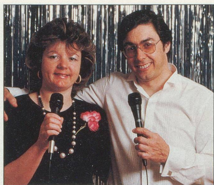
Le Duo Atlantis pour l'animation