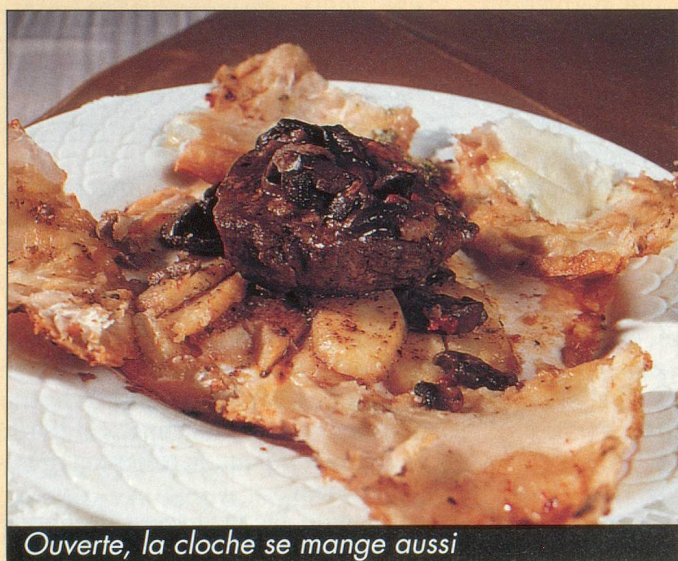
Ouverte, la cloche se mange aussi