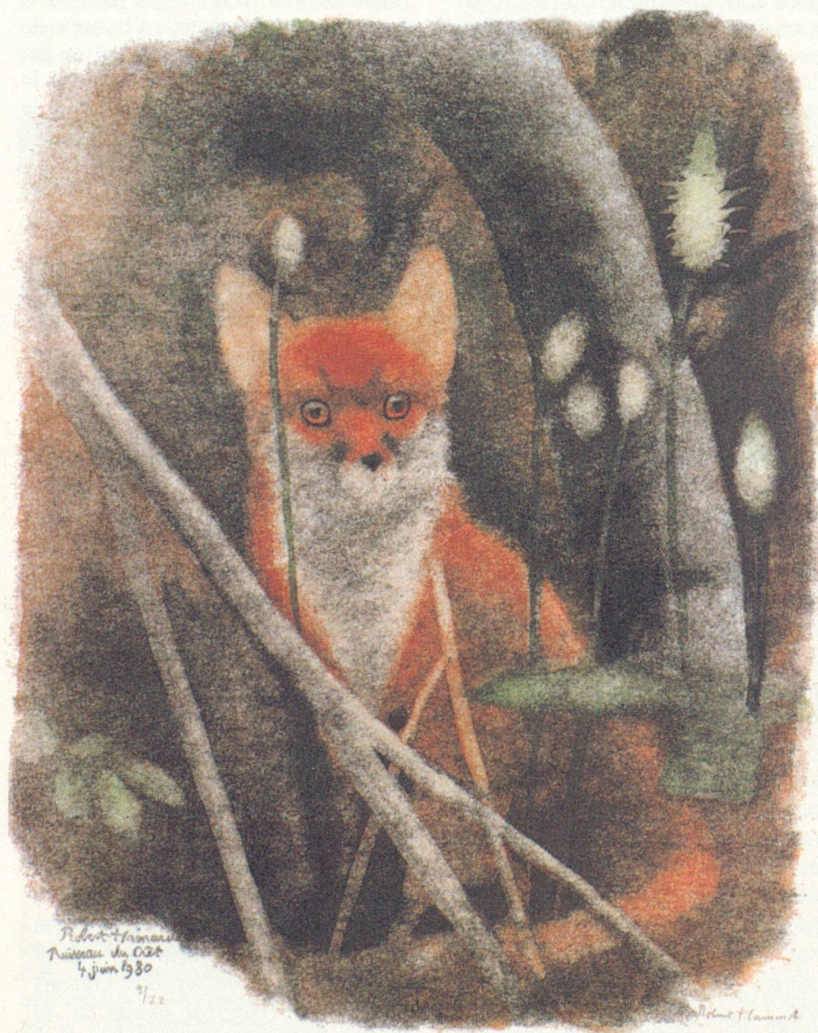
Un renardeau émancipé, saisi au ruisseau du Crêt, en juin 1980

Des milliers de gravures sont classées, les sculptures d'animaux sont alignées en rangs serrés. Ici ou là, un visage de nourrisson ou un buste d'enfant témoigne du talent exceptionnel de Robert Hainard, mais surtout de son amour pour ses enfants et petits-enfants qu'il sculptait à différents âges. Car même s'il a passé une part essentielle de ses jours dans la nature, Robert Hainard avait l'amour des siens, et de ses semblables. Très