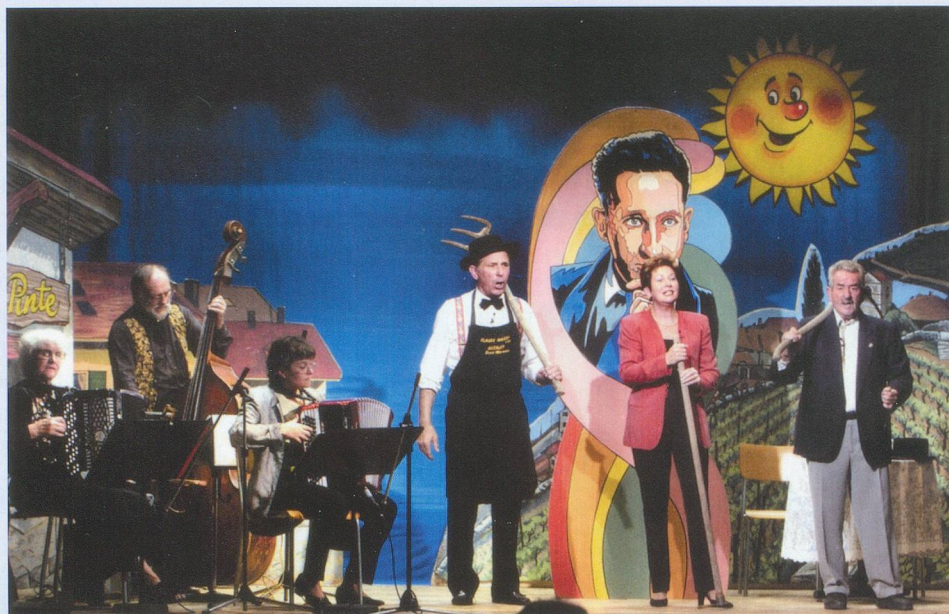
Animation: la troupe du Cabaret du Cœur.

Matinée en croisière. Déjeuner à bord. Débarquement à Avignon à 16 h. Visite guidée facultative de la Cité des Papes. Le palais abritait jadis une cour fastueuse. A ses pieds, le Pont-d'Avignon semble bien étroit «pour y danser tous en rond»... Retour à bord. Dîner.