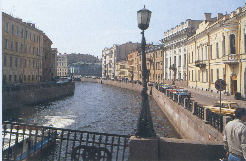
Un défilé de palais et de maisons de maître borde la Neva.

N'empORTEZ que le minimum d'argent nécessaire à vos achats de la journée.