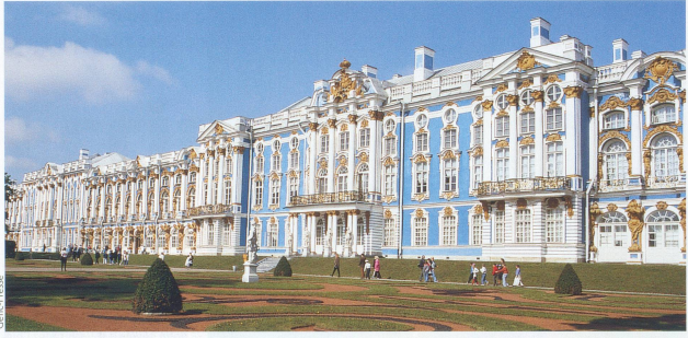
Le palais Catherine, à Pouchkine, à ne manquer sous aucun prétexte.