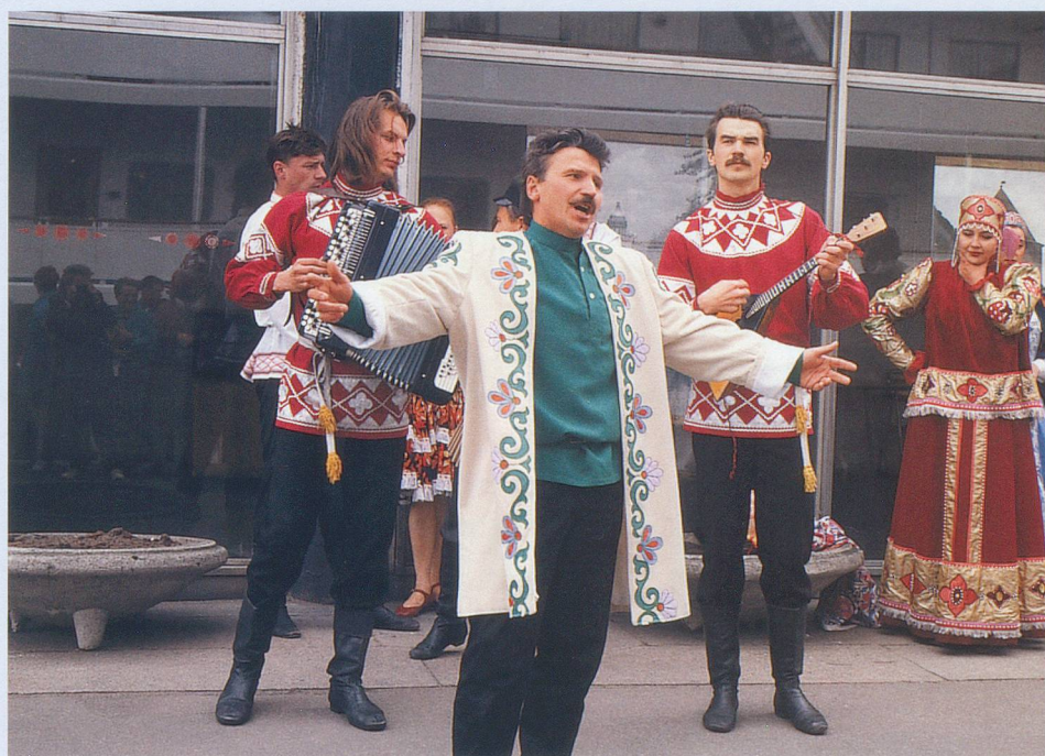
Les orchestres de rue, avec accordéon et balalaïka, accompagnent les passants.

bre double dans un hôtel***, repas et excursions selon programme, service d'un guide parlant français, transport en car. (Non compris: visa, assurance annulation obligatoire, boissons et dépenses personnelles.)