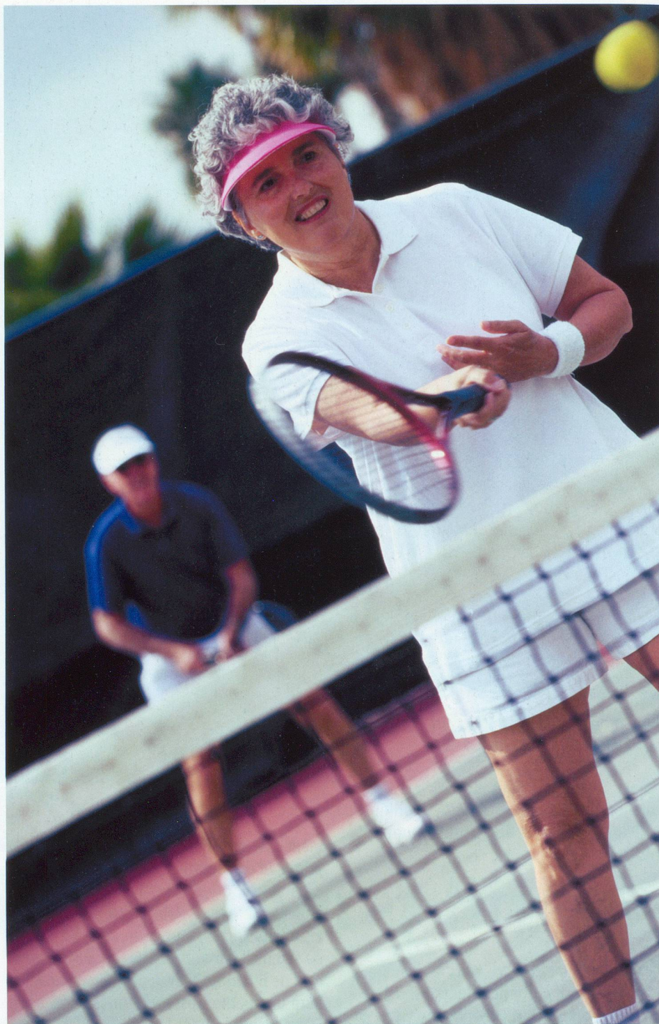
Le tennis est l'un des sports préférés des seniors.