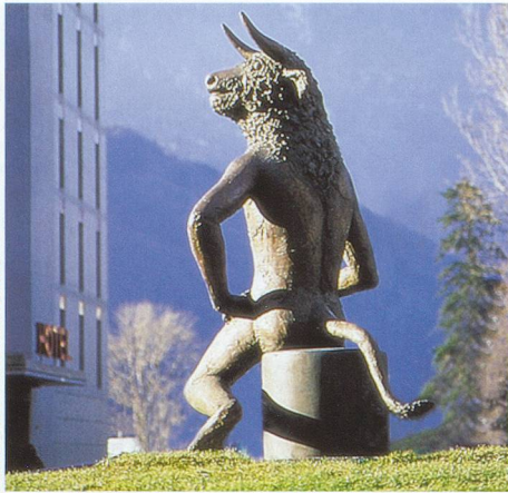
Fondation Pierre Gianadda

Fondation Louis Moret , ch. des Barrières 33, tél. 027 722 23 47.