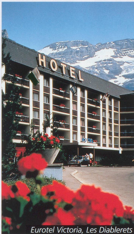
Eurotel Victoria, Les Diablerets

Par personne en chambre double. (Supplément de Fr. 40.- en chambre indiv.)