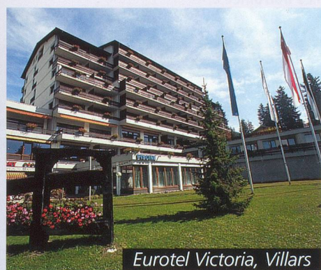
Eurotel Victoria, Villars