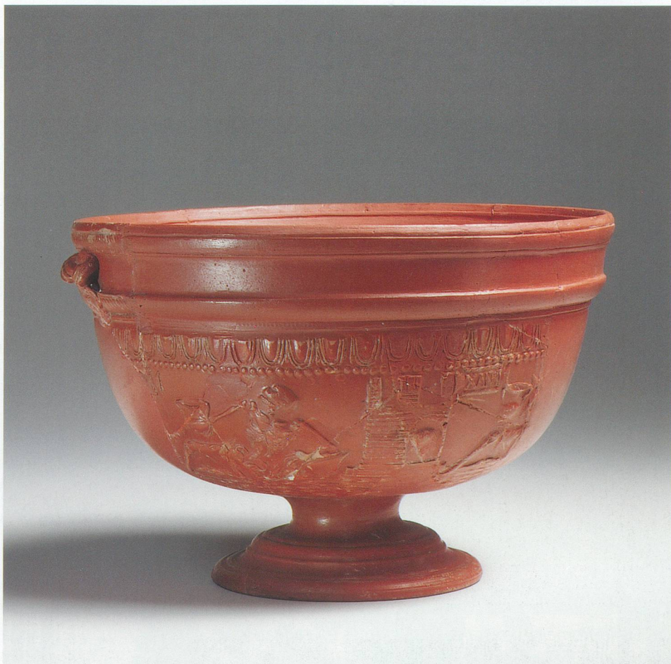
Les Romains ont importé leur vaisselle de luxe: la sigillée.

Le MDA vaudois organise chaque année des visites guidées sur des sites romains, en collaboration avec le Musée romain de Lausanne-Vidy; renseignements au 021 321 77 66.