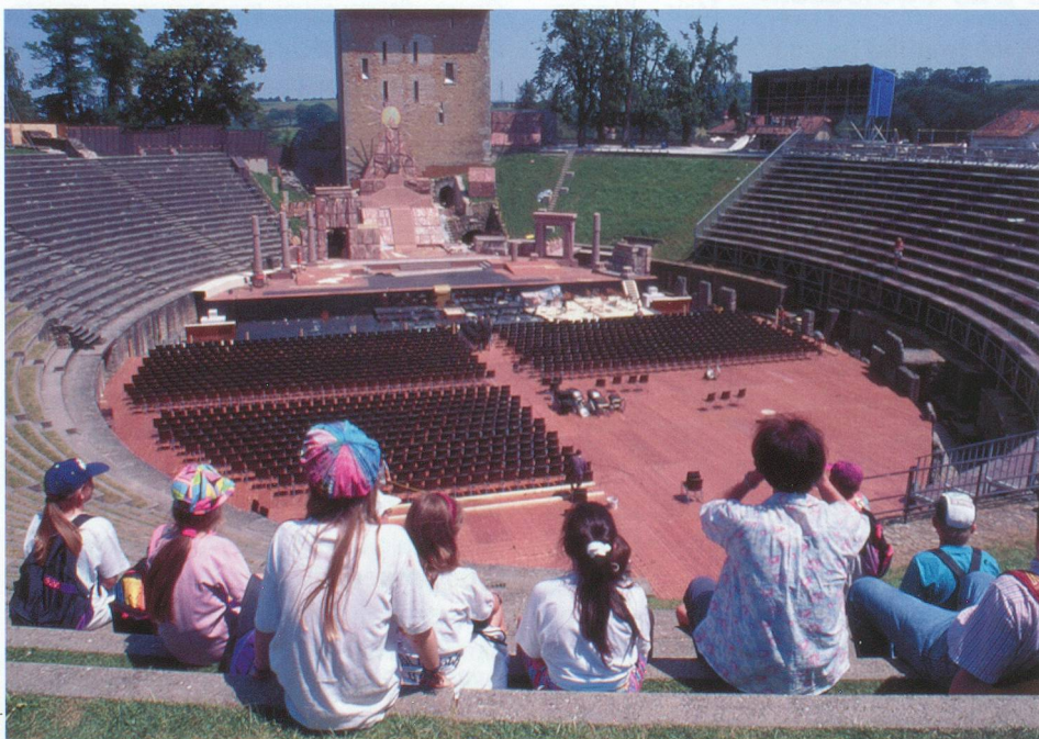
L'amphithéâtre d'Avenches accueille encore des spectateurs, 2000 ans plus tard.

L'installation d'une légion romaine en garnison à Vindonissa (Windisch) s'inscrit dans l'occupation progressive des lieux de passage stratégiques. On est alors en 14 après J.-C., et l'empereur Tibère vient de renoncer à